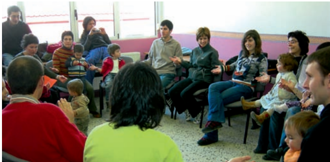
Jolas eta kantu ikastaroa, 2008. Umeak hizkuntzaz jabetzeko beharrezkoa da transmisio aberatsa.

Familia da umeek hizkuntza ondo ikasteko biderik egokiena. Gurasoei transmisio horretan laguntzeko hainbat ikastaro eta material eskaintzen zaizkie.