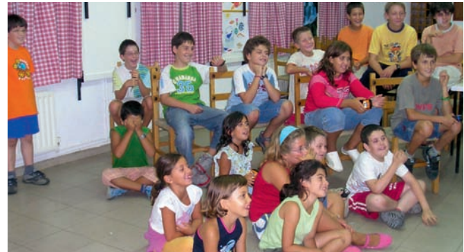
Euskara maila hobetzeko saioetan parte hartzen duten umeak. 60 inguru ume eta gazte dabilta azken urteetan, etorkinak zein bertan jaiotak.

Auto-gidari karneta euskaraz Carnet de conducir en euskera