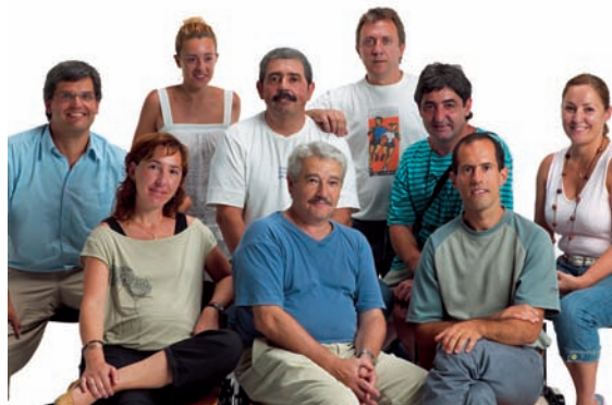
Sindikaturak eta euskara planak dituzten enpresetako ordezkariak, 2006.

Enpresetan euskara planak bultzatuz Establezimendu komertzialentzako materialak Promoción de planes de normalización en nuevas empresas Creación y difusión de materiales en euskera para los comercios