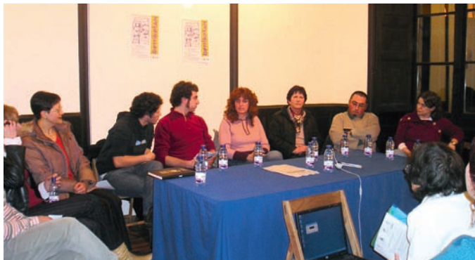
Berriketan programaren aurkezpena 2006ko urtarrilean. 15 euskaldunzahar eta 30 euskaldunberri inguru elkartzen dira astean behin euskara praktikatzeko.

Euskaraz ikasi edo euren euskara maila hobetu nahi duten 16 urtez gorako herritarrek gero eta erraztasun handiagoak dituzte: