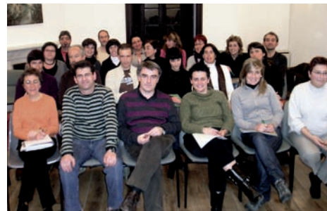
EBPNko batzar orokorra.