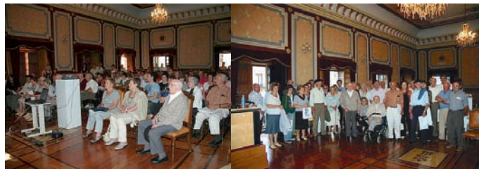
Bergarako ahotsak egitasmoaren aurkezpena. Bergarako euskalkiaren grabazioak.

Uno de los objetivos fijados en el Plan es la promoción del euskara de Bergara, principalmente en los ámbitos informales. Durante los últimos años se ha realizado una gran labor de recogida y difusión que se quiere continuar en los próximos años, especialmente con miras a mejorar el euskara hablado de los jóvenes: