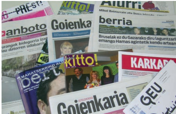
Udalak euskarazko prentsaren harpidetza bultzatzen du.

Cada vez es mayor la importancia que las nuevas tecnologías y los medios de comunicación tienen en nuestras vidas. Son numerosas las actividades encaminadas a aumentar la oferta y la demanda en euskera en este ámbito: