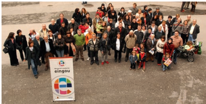
2008an herriko 85 entitatek “eingou” euskara bultzatzeko hitzarmena sinatu zuten.

Aisialdiko jardueratan euskaraz jardutea ere garrantzitsua da. 2008an esparru soziokulturalean lanean diharduten herriko 85 entitatek “eingou” euskara bultzatzeko hitzarmena sinatu zuten.